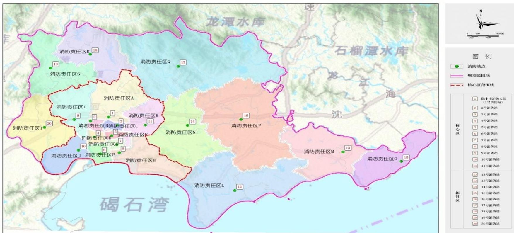
陆丰市“十四五”消防责任区划分及消防站点布局图